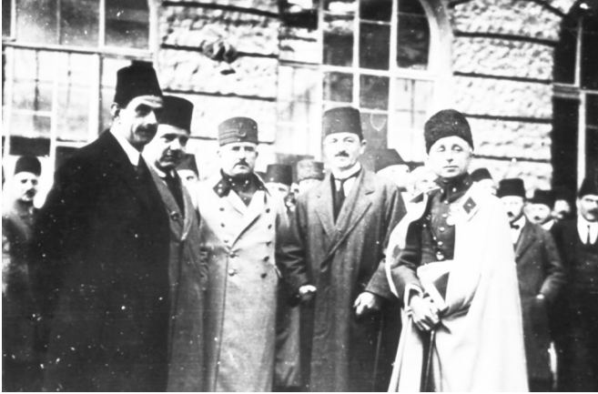
Soldan sağa Adnan (Adıvar), Ali Fuat (Cebesoy), Kâzım Karabekir, Rauf (Orbay), Refet (Bele)

Tarih sahnesinde var olduğundan beri bağımsız yaşamış Türk Milleti özgürlüğüne kavuşmuştu.