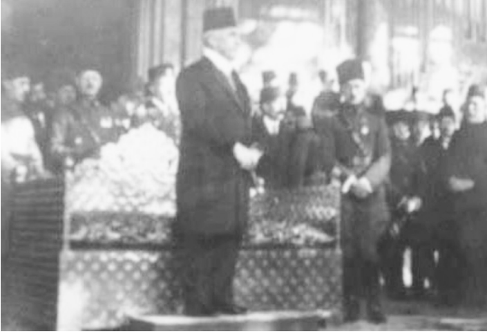
Son Halife Abdülmecit Efendi ile Refet Paşa