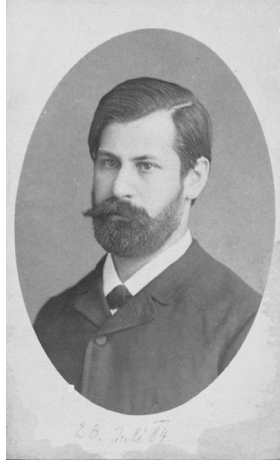
Sigmund Freud, 1884