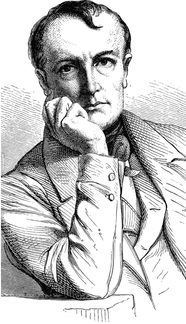
Paul Delaroche (1797-1856) The French painter's self portrait