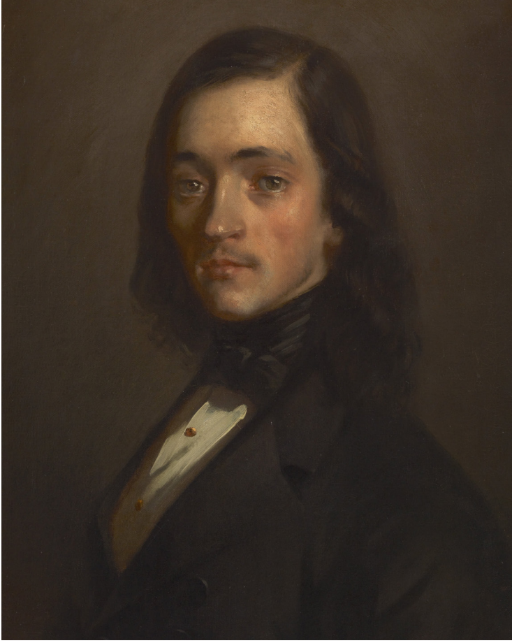
Jean-François Millet (1814-1875) / Portrait of a Man, 1840/1841, 59 x 47 cm, Tokyo Fuji Art Museum, Hachioji, Japan

Millet, Delaroche ile anlaşamamış, Akademi'deki sofistike, şehirli öğrenciler de onun resimleriyle alay etmişlerdi. Bunun üzerine Millet, kendine ait küçük bir stüdyo açtı, geçimini sağlamak için portreler yapmaya başladı. Nasıl ki küçük yaşlarda okuduğu Goethe, Shakespeare ve Victor Hugo eserleriyle kendi kendini eğitmişti, sanatsal anlamda da kendi kendini eğitebilirdi.