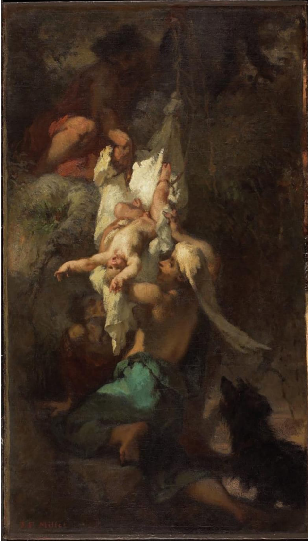
Jean-François Millet (1814-1875) Oedipus'un Ağaçtan İndirilişi / Oedipus Taken Down from the Tree 1847, Oil on canvas, 133.5 x 77.5 cm, The National Gallery of Canada, Ottawa