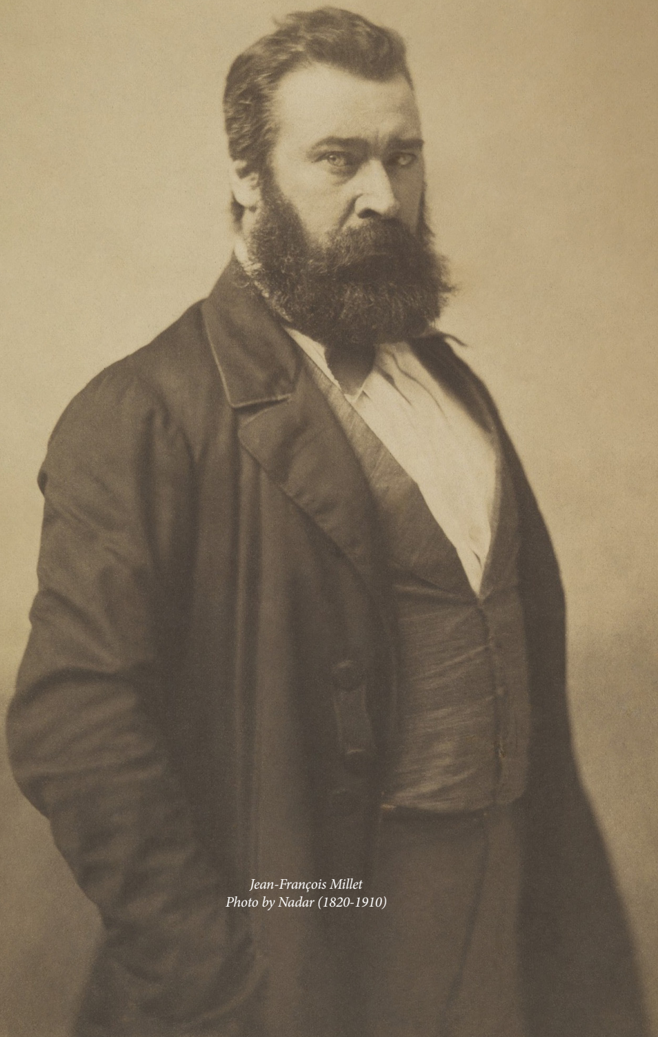
Jean-François Millet