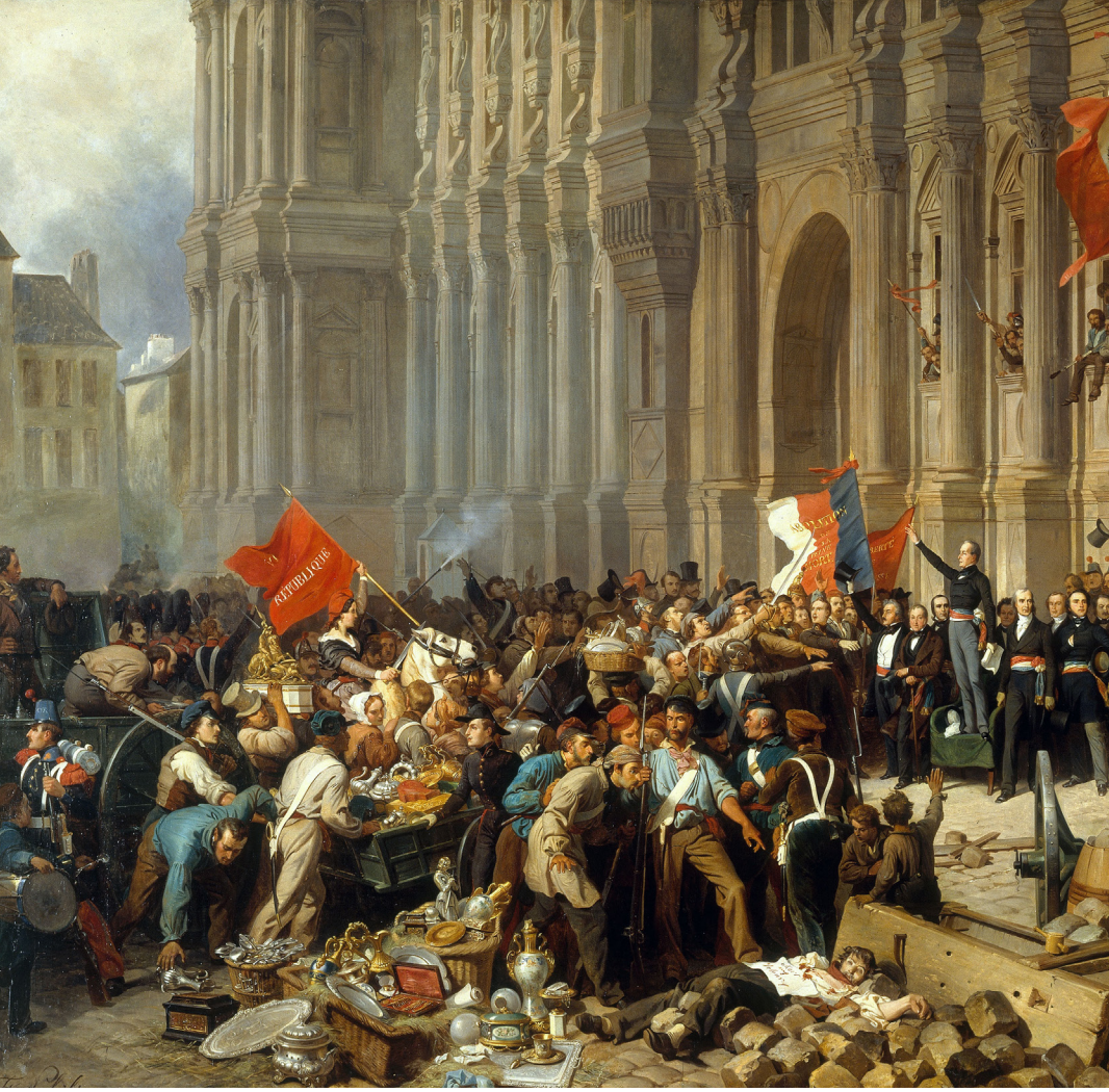
Henri Félix Emmanuel Philippoteaux (1815-1884) Lamartine in front of the Town Hall of Paris rejects the red flag on 25 February 1848, Oil on canvas, Musée Carnavalet, Paris

tığı bu resimde babası Laios (Thebes'in mitolojik kralı) tarafından hayvanlara yem olsun diye ayaklarından bir ağaca asılıp ölüme terk edilen çocuk Oedipus'un çobanlar tarafından kurtarılışını resmetti. Baba Laios, kehanete göre oğlunun büyüdüğü zaman kendisini öldüreceğini düşünüyordu, çobanlar (Şiş Ayak) Oedipus'u kurtarınca bu talihsiz kehanetten kaçamadı.