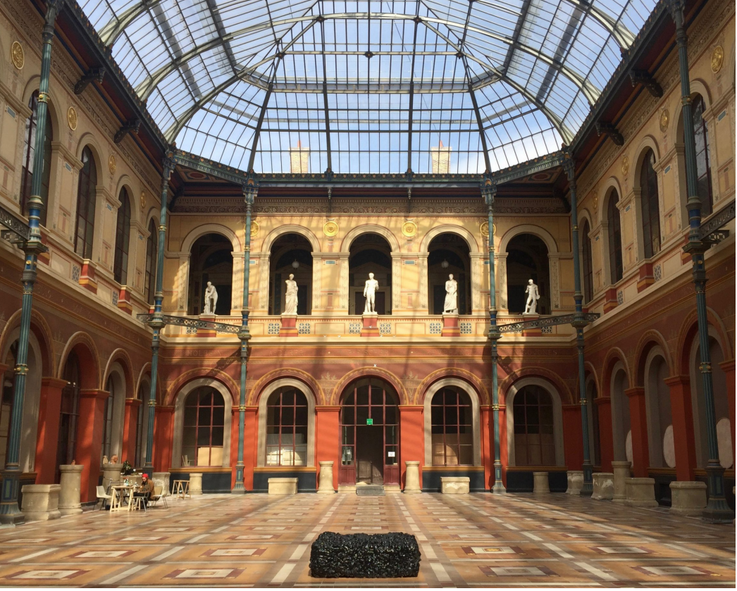
École des Beaux-Arts / 14 Rue Bonaparte, 75006 Paris, Fransa

ve çevresindeki herkes ona bir ressam gözüyle bakmaya başlamıştı. Çocuğunun yeteneğinin farkında olan baba onu ilk sanat eğitimi için Cherbourg-Octeville’de yerel bir portre ressamı olan Mouchel’in yanına götürdü. Bu aslında Millet’in yeteneğinin de test edilmesi anlamına geliyordu. Babası, Millet’den Mouchel’e göstermesi için birkaç çizim yapmasını istedi. Millet çizimleri yaptı, birlikte gittiler. Babası çizimleri Mouchel’e gösterip, “Nasıl buldunuz? Benim çocuğumda yetenek var mı?” dediğinde Mouchel, “Siz benimle dalga geçiyor olmalısınız, bu çizimleri bu çocuk yapmış olamaz!” dedi. Babası gülererek, “Bu çizimleri gözlerimin önünde yaptı...” dediğinde Mouchel, “Sizin çocuğunuzun içinde çok büyük bir ressam yatıyor...” diye karşılık verdi. Çizimlerden