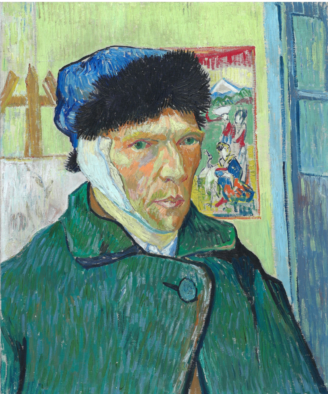
Vincent van Gogh (1853-1890), Self-portrait with bandaged ear , January 1889, Arles, Oil on Canvas, 60,5 x 50,0 cm, Courtauld Institute of Art