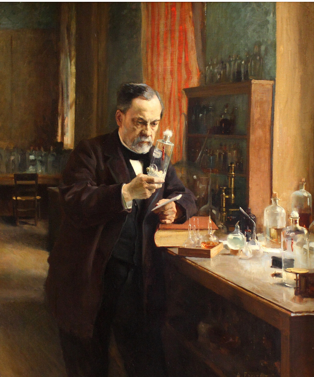
Albert Edelfelt (1854-1905) / Louis Pasteur, 1885, Oil on Canvas, 154 x 126 cm, Musée d'Orsay