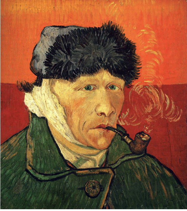
Vincent van Gogh (1853-1890), Self-portrait with bandaged ear and pipe , 1889, Oil on Canvas, 51 x 45 cm, Kunsthau Zürich