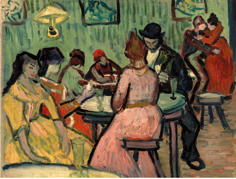
Vincent van Gogh (1853-1890), Genelev, The Brothel (Le Lupanar), 1888. Oil on Canvas, Barnes Foundation

kimliğine tam olarak hâkim olmadığı için o kısmı bilgiyle değil, öngörülerıyla açıklamış olmalıydı.