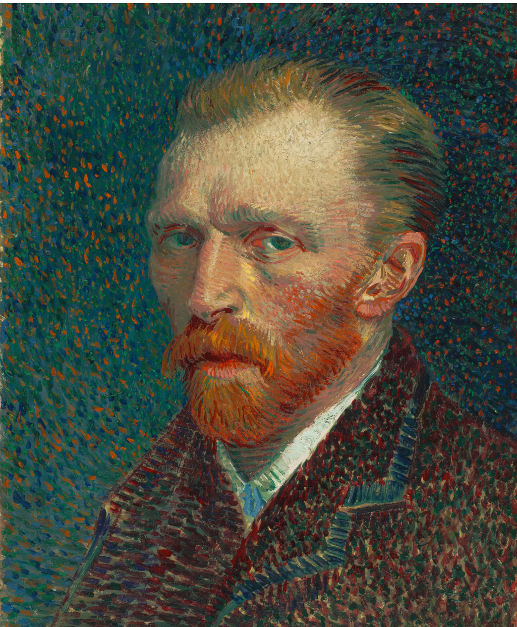
Vincent van Gogh (1853-1890), Self-Portrait, 1887, 41 x 32.5 cm, The Art Institute of Chicago