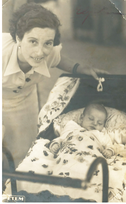
Genç yaşta kaybettiğim annem, beşiğimin başında gülümsüyor.