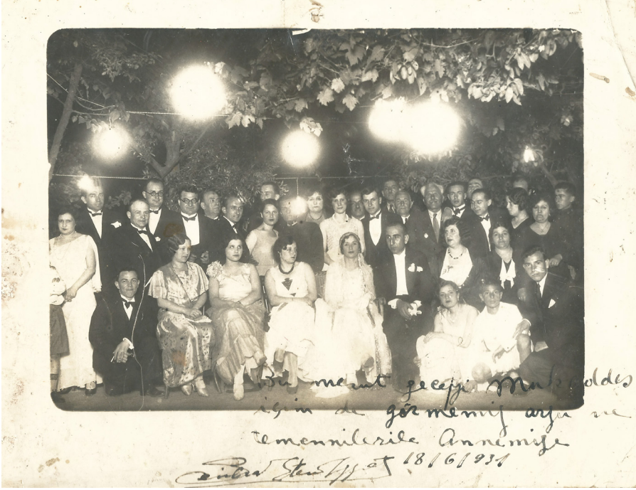
Annem ile babamın düğünü, 1931.

İkinci sınıfa geçtiğimde 2. Dünya Harbi sırasında İstanbul'da yaşamak tehlikeli hale gelmiş, birçok aile, Anadolu'ya geçmişti. Boğazlar nedeniyle İstanbul'a da saldırı olması ihtimali vardı ve tehlike yakından hissediliyordu. Asıl mesleği gazetecilik olan babamın milletvekili olması ve bir süre Ankara'da yaşamamız da gerekince, Ankara'ya taşınmayı uygun bulduk.