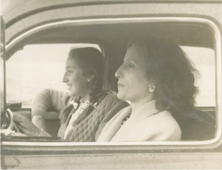
Çok iyi bir şoför olan annem araba kullanıyor. Yıl 1946.