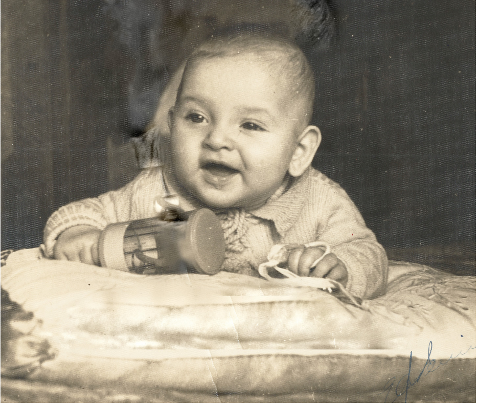
1935 yılında, henüz bir bebekken çekilen ilk fotoğraflarımdan biri.