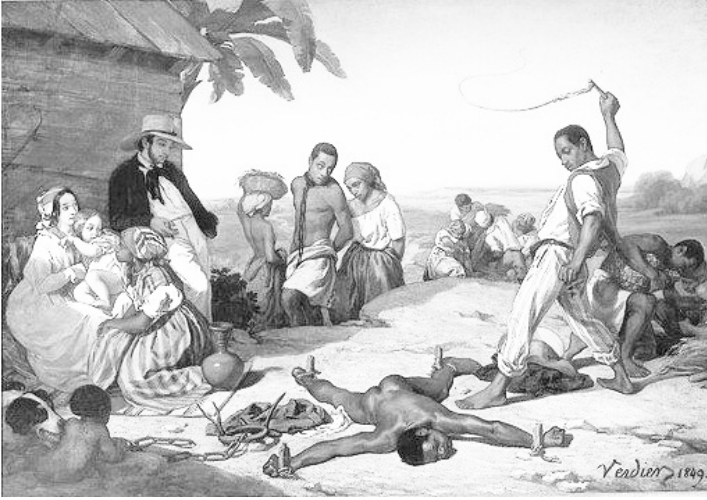
Fransız ressam Marcel Verdier'in 1849 yılında çizdiđi, itaatsiz Afrikalı kölelerin diđer bir Afrikalı köle tarafından cezalandırılışını resmeden tablo

Dünyada üretim modeli 19'uncu yüzyıldan itibaren feodalizmden sermaye ekonomisine dönüşmeye başlarken kölelik sistemi de şekil deđiřtirdi. Bu bir paradigma deđiřimiydi elbette. Toprađa dayalı üretim, yerini makinelere dayalı bir üretime bıraktı. Ekonomi, beraberinde siyaseti ve sosyolojiyi de deđiřtirdi.