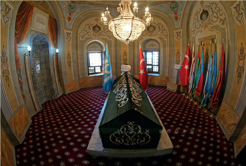
Ertuğrul Gazi Türbesi (Bilecik ilinin Söğüt ilçesi)