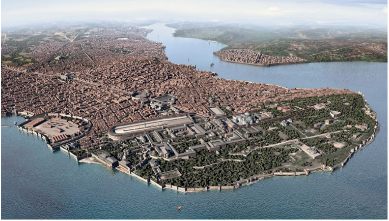
Latin istilası öncesi İstanbul'un görünümü