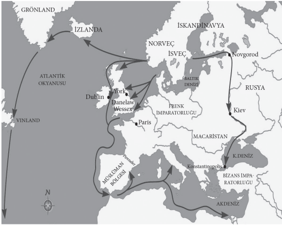
Vikingerin keşif haritası