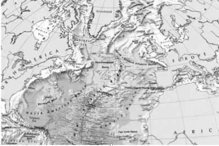
Şekil 3: Orta-Atlantik Sırtı, Platon'un Atlantis'i konumlandığı Atlantik Okyanusu bölgesindeki deprem ve volkanik aktivite merkezi.